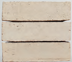
MALEA S. 10