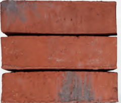
ALUNA S. 40