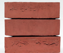
INOA S. 34