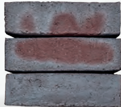
KIMO S. 46