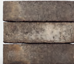
ELANIE S. 56