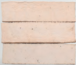
CAVEN S. 8