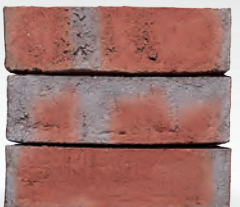
LIVA S. 42