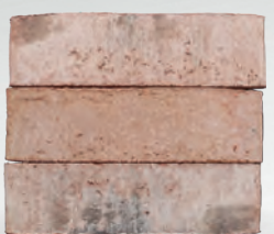
HARU S. 18