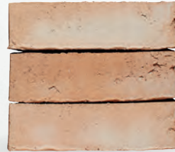
KALEA S. 22