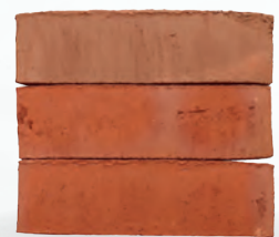
ALANI S. 30