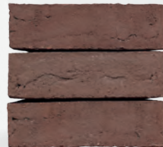
TANO S. 54