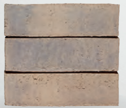
NAKOA S. 16