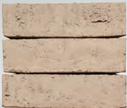
LANIA S. 12