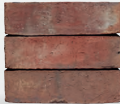
MANOA S. 50