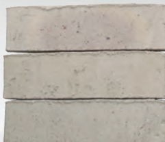
VIANO S. 62