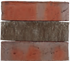
INARA S. 38