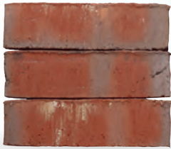
NARAN S. 36