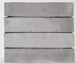
NIARA S. 64