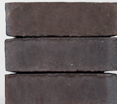
MOANA S. 58