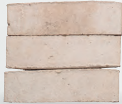
ADEVA S. 14